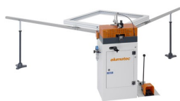
Lis pro spojování rohů EP 120