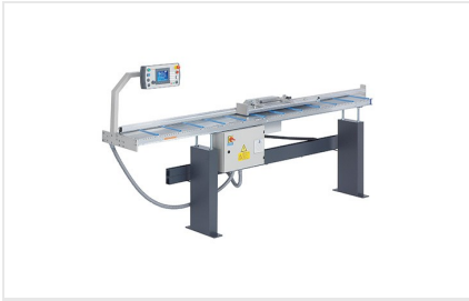
Dorazový a měřicí systém AMS 200 + E 355