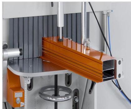
Čelní fréza AF 223/01