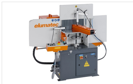
Čelní fréza AF 223/01