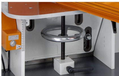
Čelní fréza AF 223/01