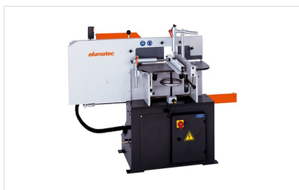
Čelní fréza AF 222/02