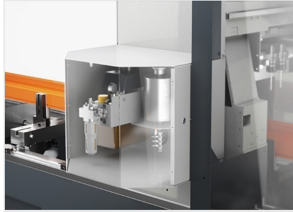
Centre d'usinage de barres SBZ 141