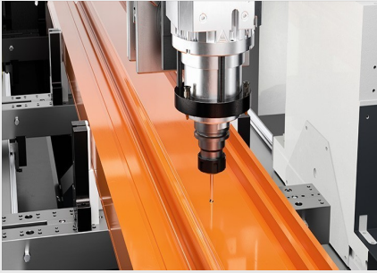
Centre d'usinage de barres SBZ 141