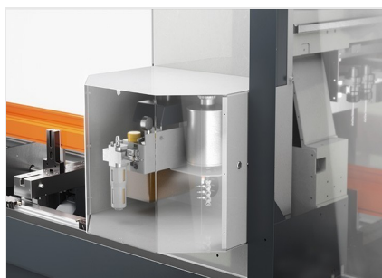
Centre d'usinage de barres SBZ 141