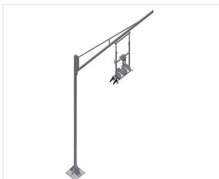
Support d'appareil G 3000 + colonne en acier S 3000