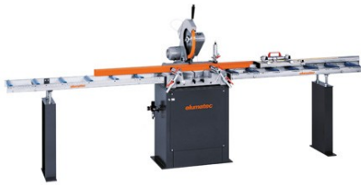
Scie à onglets MGS 72/10

MGS 72/10 + MMS 100 + Convoyeur à rouleaux