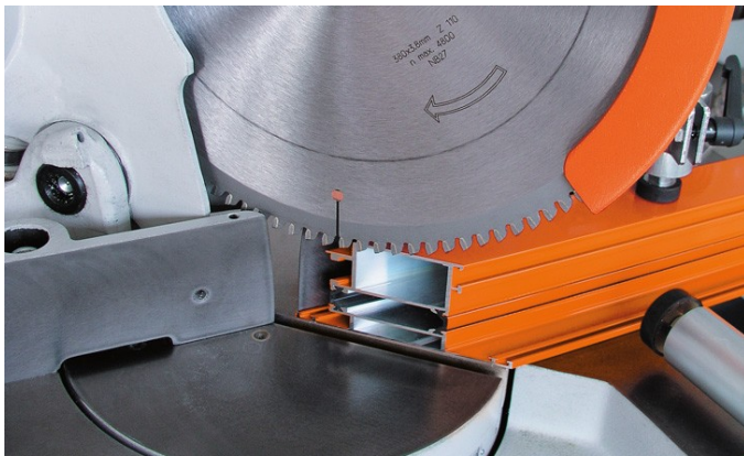
Scie à onglets MGS 72/30