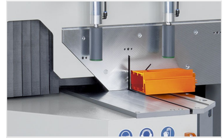
Scie à onglets MGS 105