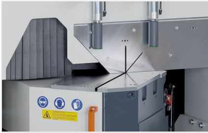
Scie à onglets MGS 105