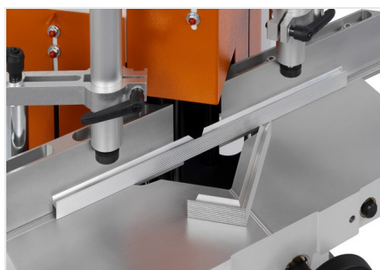
Entailleuses en V KS 101/30