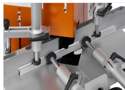
Entailleuses en V KS 101/30