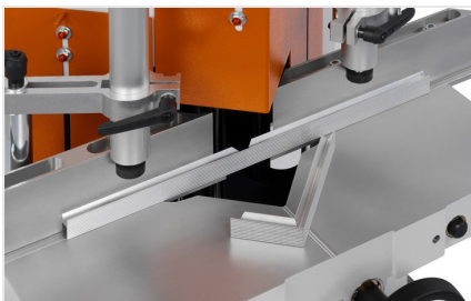
Entailleuses en V KS 101/30