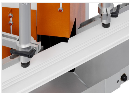
Entailleuses en V KS 101/30