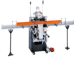
Fraiseuse à copier triple-broche KF 178/10