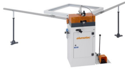
EP 120 Sertisseuse d'angle