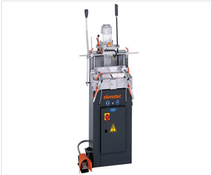
Fraiseuse à copier mono- broche AS 70/44