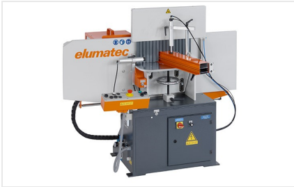
Fraiseuse en bout AF 223/01