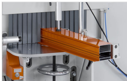
Fraiseuse en bout AF 223/01