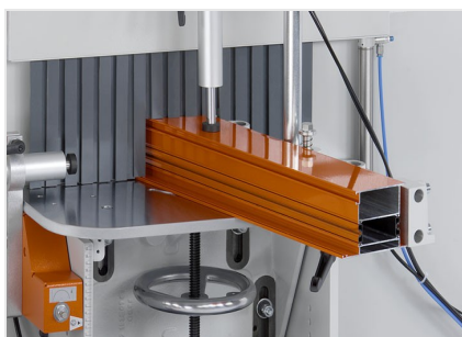
Fraiseuse en bout AF 223/01