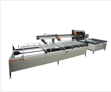
Banco de corte a medida SBZ 616