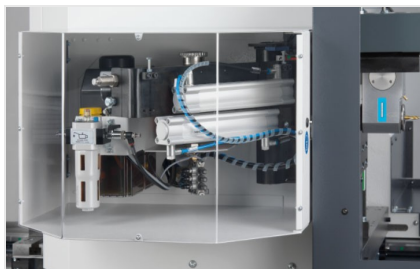
SBZ 140 Centro de mecanizado de barras