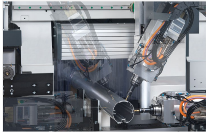
SBZ 140 Centro de mecanizado de barras