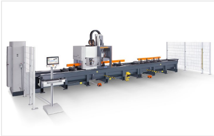
SBZ 140 Centro de mecanizado de barras