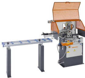
Tronzadora automática SA 73/36