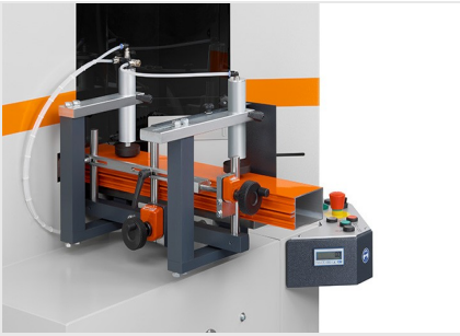
Tronzadora retestadora AKS V-550