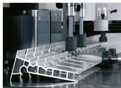
Sägeautomat SAS 142/44