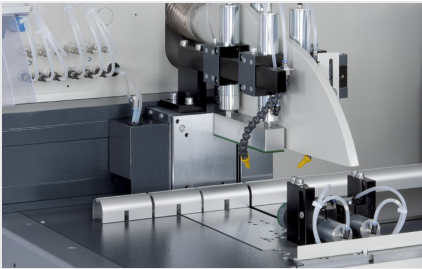
Sägearbeitzeug SAS 142/44