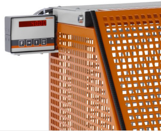
Sägeautomat SA 73/36