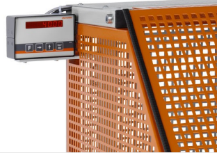
Sägeautomat SA 73/36