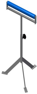
Rollenbock MST 1000