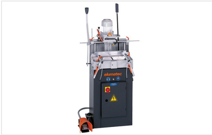
1-Spindel-Kopierfräse AS 70/44