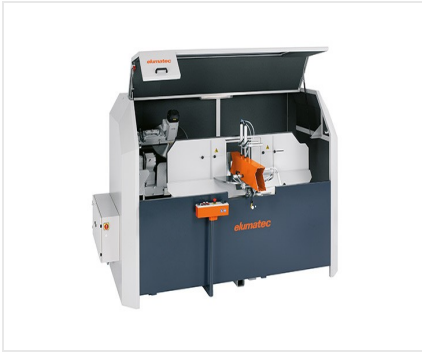
AKS 134/64 + Sonderzubehör