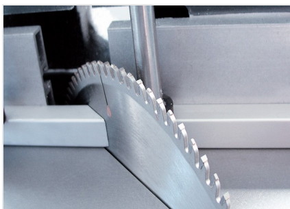
Stolní pila TS 161/21