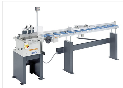
Stolní pila TS 161/21 + MMS 200