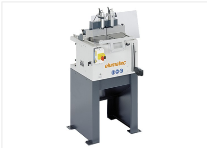
Stolní pila TS 161/21