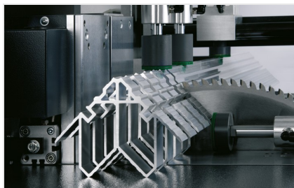
Pilový automat SA 142/38