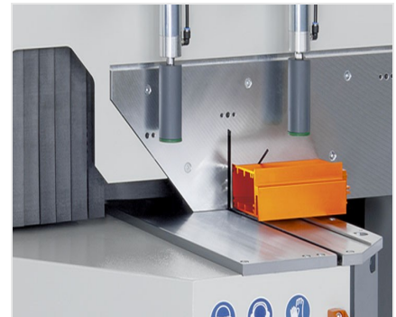
Pokosová pila MGS 105