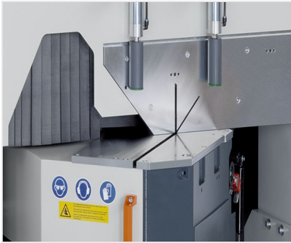
Pokosová pila MGS 105