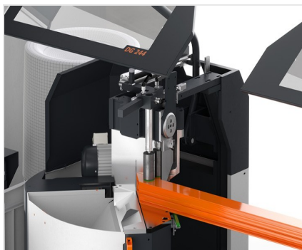
Dvoukotoučová pila DG 104