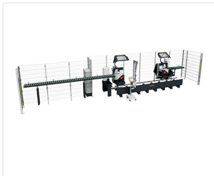
Dvoukotoučová pila DG 104 + speciální příslušenství