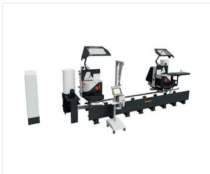
Dvoukotoučová pila DG 104 + E 590