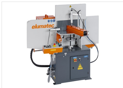
Čelní fréza AF 223/01