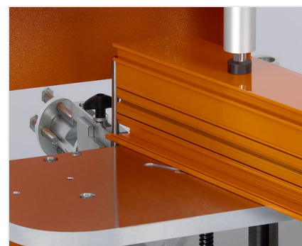
Čelní fréza AF 223/01