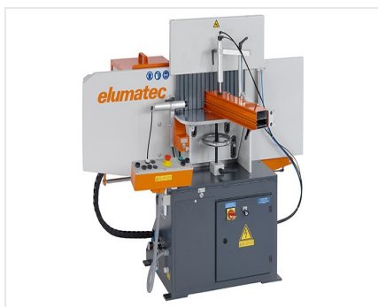
Čelní fréza AF 223/01