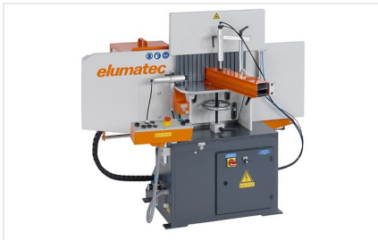
Čelní fréza AF 223/01