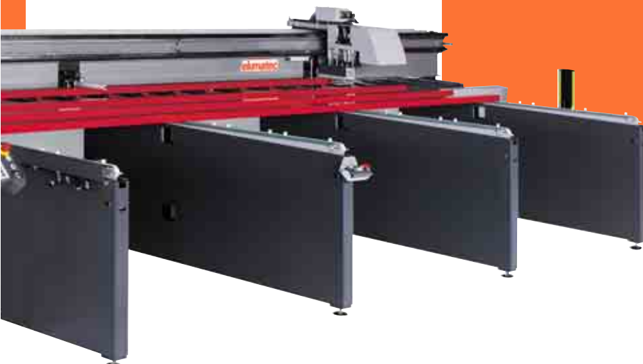
[ SAP 650/15 ]