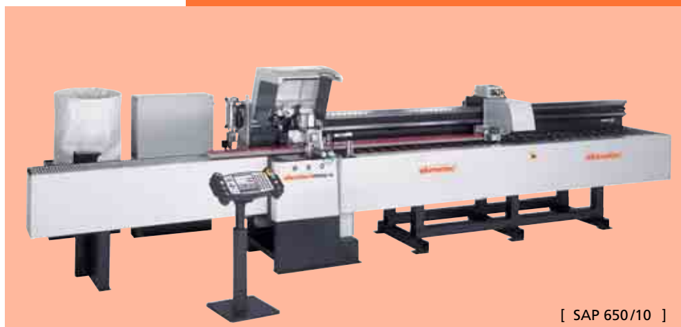
[ SAP 650/10 ]