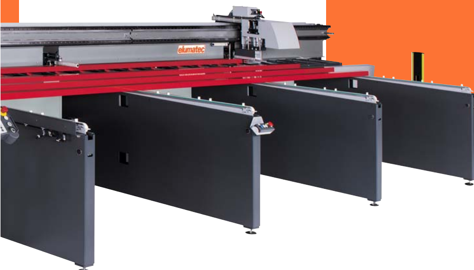
[ SAP 650/15 ]