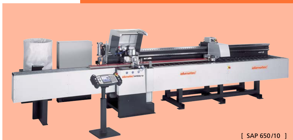
[ SAP 650/10 ]