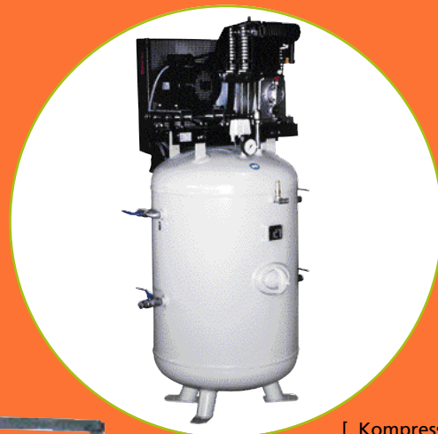
[ Kompressor ]