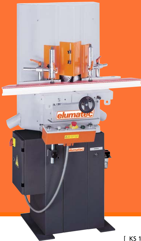
[ KS 101/30 ]