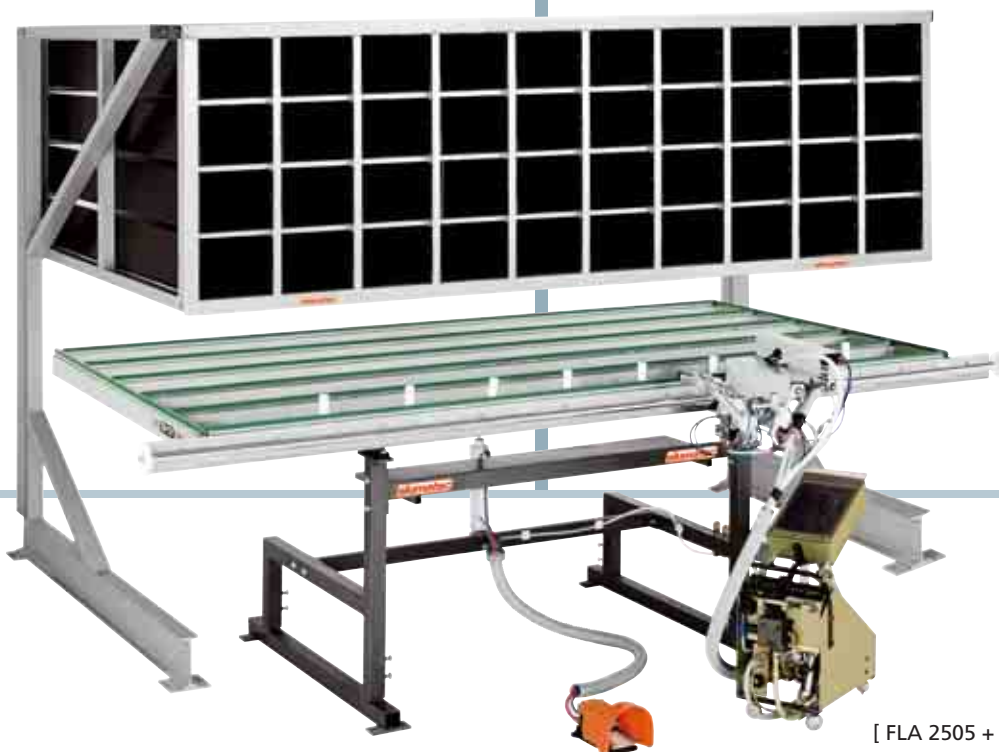
[ FLA 2505 + Beschlagregal ]